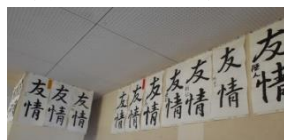
写真～校内書きぞめ展より～

3年 S K I F K I 2年 S I K S S 1年 T M A M F