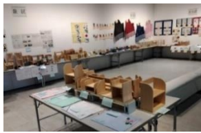
写真～合同作品展会場の様子～