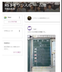
↑クラスルームの一例

なお、各学級のクラスルームは、すでに多くの学級がクラス内連絡等のために活用しております。詳しくは、各学級・学年便り等を御確認ください。