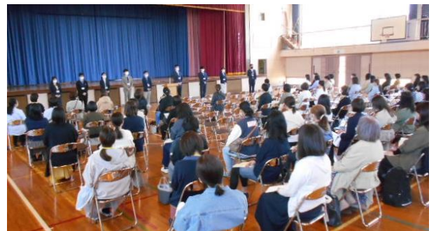
【学年懇談会の様子】