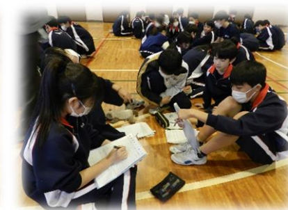
気になった本の共有タイム