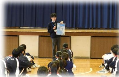
「時生」 未来を変えるきっかけを!