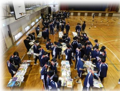
選書をしている様子