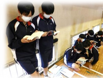
読書コーナー開設!?