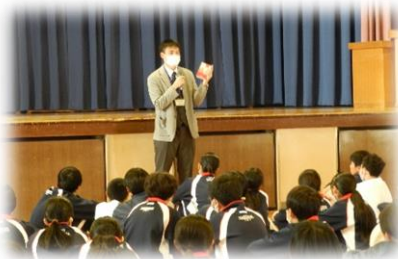
「空想科学読本」 努力したらおもしろい!