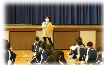
「オーファーザー」 伏線回収のすごさ!!