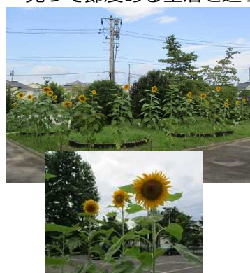
【校地内に咲いたひまわり】

8月7日(金)、夏休み前集会と文化祭に代えての文化部の発表会を予定していましたが、高温が予想されたため、発表会は残念ながら延期とし、集会は放送で行いました。学校長からは「自分自身に克つ・誘惑に克つ=克己(こっき)」について触れ「夏休み中は、克己心を持った生き方、誘惑に打ち克って節度ある生活を送ってほしい」との話がありました。