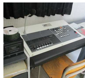
【夏休み前集会は放送で実施】

令和2年度の夏休みは、新型コロナウイルス感染拡大の影響により、これまでの夏休みとは全く違う夏休みとなりました。4・5月と臨時休業が続いた分の授業時間確保のため、夏休み35日中16日が登校日となりました。まとまった休みは11日間でしたが、充実した夏休みを過ごせたいでしょうか。学校の夏休み中の授業は、今年度から普通教室にエアコンが設置されたことで、例年とは比較にならないほど快適な学習環境の中で学習に取り組み、また、8月上旬に実施された三者面談では、保護者の皆様に御来校いただき、生徒の状況について共通理解が図れたことは今後の指導に大いに役立てたいと考えております。御協力いただいたことに、心より感謝申し上げます。