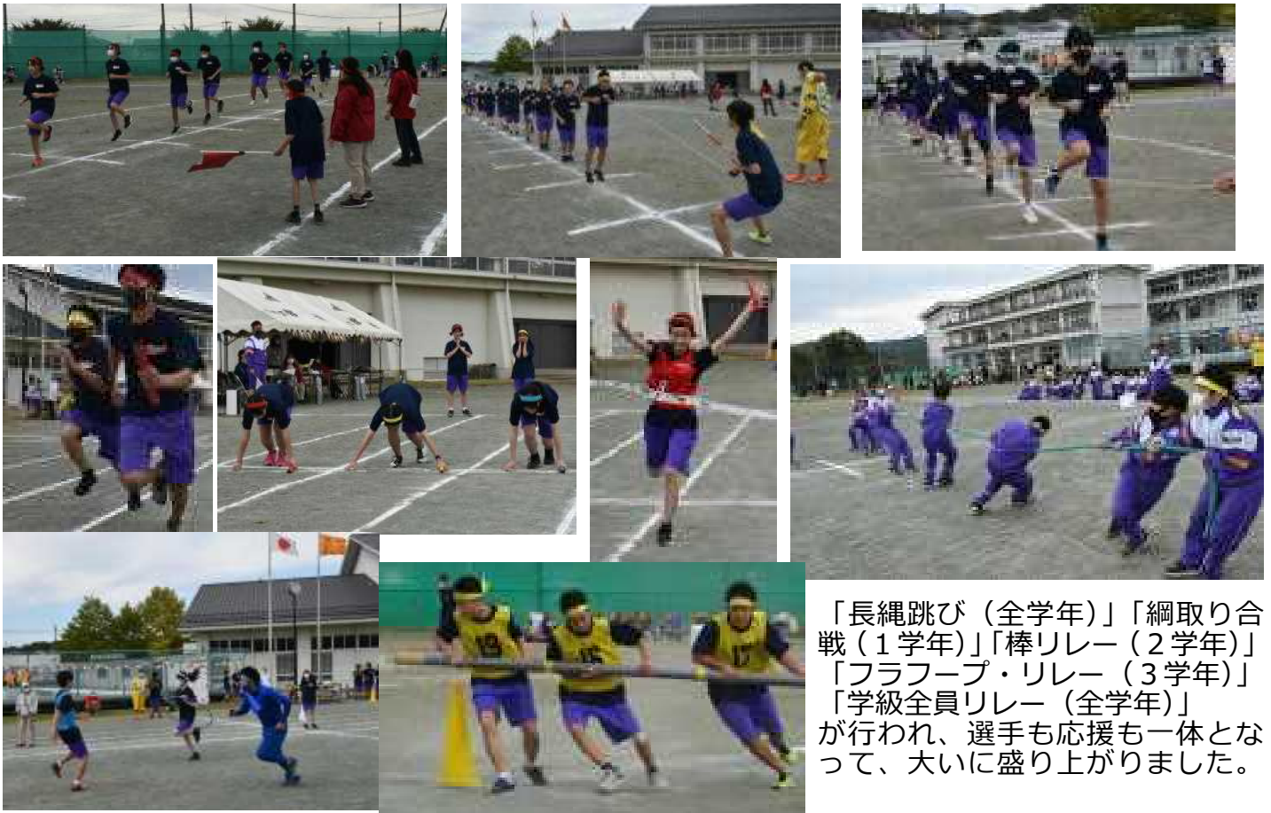
「長縄跳び（全学年）」「綱取り合戦（1学年）」「棒リレー（2学年）」 「フラフープ・リレー（3学年）」 「学級全員リレー（全学年）」 が行われ、選手も応援も一体とな って、大いに盛り上がりました。