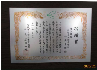
【受賞した楯に入った賞状】