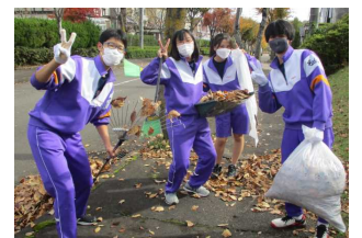
【11月学年ごとに実施した 落ち葉拾いボランティア】

この他にも、いただいた令和3年度の改善点や課題は、令和4年度に生かし、今後も生徒が安心・安全に学べる環境作りを目指してまいります。なお、新型コロナウイルス感染拡大の影響により、第2回学校運営協議会は紙面開催とさせていただきますことを、併せて御報告いたします。