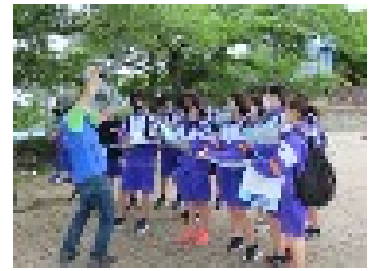
【石巻での防災まち歩き】