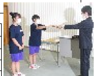
【合唱コンクール表彰】