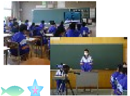
【リモートでの生徒総会】

報告が遅れましたが、6月1日(火)にリモートによる前期生徒会総会が行われました。第26代生徒会の活動方針は「元気なあいさつが飛び交う生徒会」「何事も前向きにチャレンジできる生徒会」「互いを信頼し、笑顔で助け合う生徒会」です。執行部を中心に全校生徒が一丸となって活動方針に沿った活躍を、あらゆる場面で見せてほしいと思います。