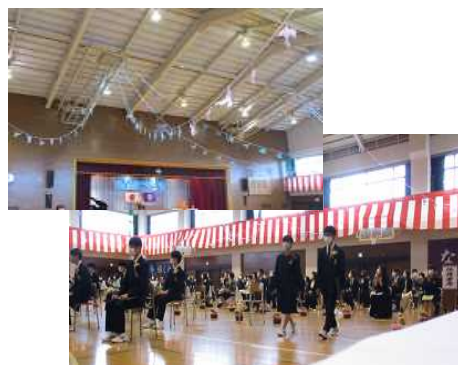
【手作りの鳩が舞う式場を後にする卒業生】

3月13日(土)、在校生代表生徒1名卒業生保護者(1~2名)教職員が見守る中、61名の卒業生が学び舎を巣立っていきました。式場となった体育館は2年生が、最後の学活を行う教室は1年生が心を込めて装飾し、会場設営を行いました。