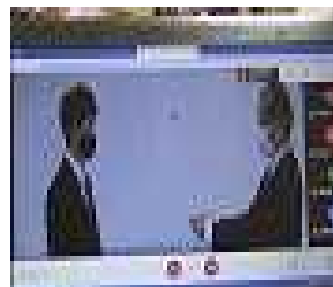
【式に先だって行われた

臨時休校で始まった令和2年度が終わろうとしています。先日、3月11日(木)には、東日本大震災から10年が経ち復興プロジェクトを行いました。全校生徒で集まることを避けるため、リモートでの復興プロジェクトを行いました。新型コロナウイルスの感染拡大は学校生活の様々な場面に大きな影響を与えました。例年通りは通用せず、何度も何度も計画を練り直した1年でした。生徒の心や体へ与えた影響も大きかったことと思います。学校では、現在も感染防止対策に継続して取り組んできています。未だ先行きが不透明な時代を過ごす子どもたちの笑顔を少しでも見られるよう、そしてどんな状況下にあっても互いに思いやりを持ち支え合っている学校を目指し、令和3年度も教職員一丸となって館中学校を運営してまいります。