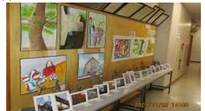
【3年美術 『活動する私』】

この他にも、頂いた令和2年度の反省点や課題は、令和3年度に生かすようにしていきたいと思えます。また、今後も全教職員で体罰及び不適切な指導の根絶について再確認するとともに、いじめの早期発見・早期対応を心掛け、生徒が安心して安全に生活できる環境作りを行ってまいります。今後とも本校の教育活動への御理解と御協力をお願いいたします。なお新型コロナウイルス感染状況により令和2年度第2回学校評議員・学校関係者評価委員会は、書面開催とさせていただきます。