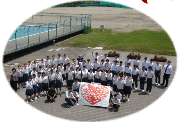
【3学年 卒業文集表紙】