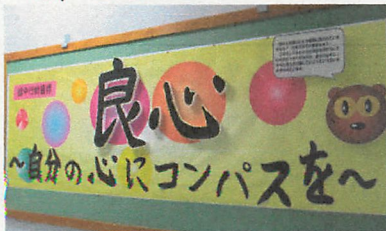
【仙台市児童生徒8万人のいじめ防止 『きずな』サミット 館中行動目標】