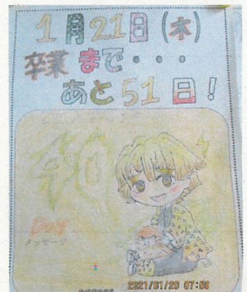
【3年 KM さん 作 卒業までのカレンダーから】

【お願い】今年度は、悪天候による予定変更が度々あり、その都度メール配信させていただいて対応していますので、 御了承ください。