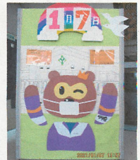
【生徒会執行部で作成した やかためき日めくりカレンダー】

1月15日(金)令和3年度新入生保護者説明会が行われました。学校長の挨拶後、中学校生活についての説明等を行いました。奨励服については販売店の都合により令和元年度より店頭での採寸・注文となっておりますが、運動着と上靴については、今年度は学校でのサイズ合わせと注文となりました。2月2日(火)には、新型コロナウイルス感染対策を講じた上で、中学校の授業と部活動見学を実施する予定です。その後は、3月26日(金)新入生予備登校を経て4月9日(金)入学式の予定となっております。