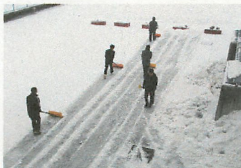
【雪かきボランティアの生徒たち いつもありがとう】