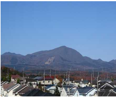
【11月 3階西側テラスから見た泉が岳】