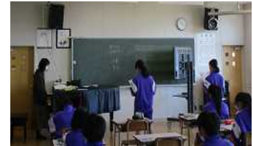
【音楽 少人数での歌唱】