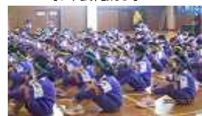
【マスク着用閉会式】