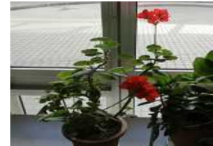
【校舎内に咲いているゼラニウム】