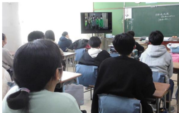
各教室で視聴しながら参加しています。