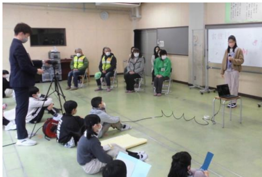
音楽室で開催している様子を生中継しました。