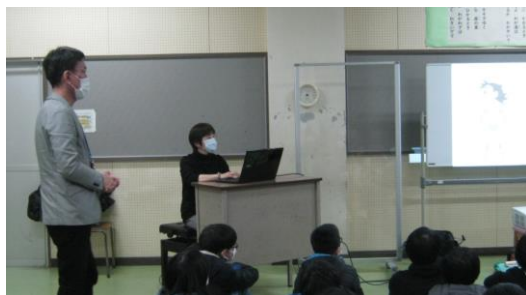
オーリーブ薬局からゲストティーチャーをお招きしました。

6年生の保健の学習に学校薬剤師さんら2名をお招きし、薬物乱用防止教室を行いました。身の回りには様々な薬がありますが、誤った使い方は乱用につながります。薬を正しく服用することの大切さを教えていただきました。