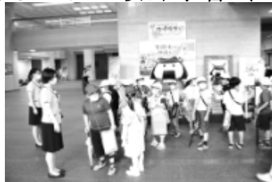
<教えて、むすび丸・宮城県庁>