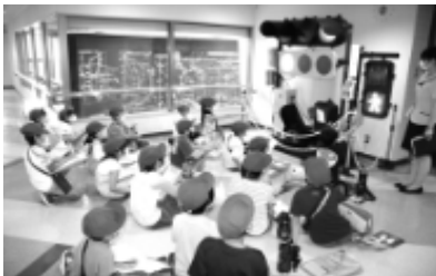
<教えて、おまわりさん・県警本部>