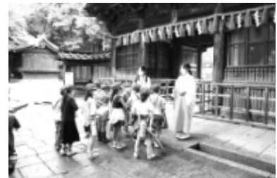
<教えて、神主さん・東照宮>