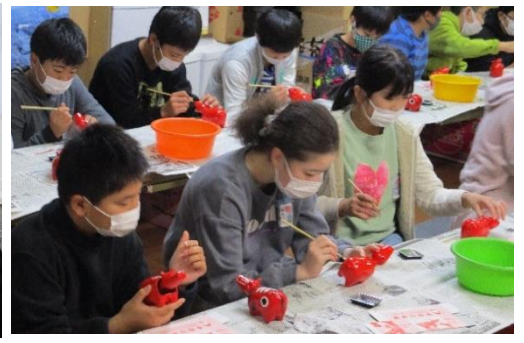
赤べこの絵付け体験