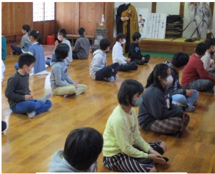
日新館で座禅体験

6年生は、11月11日(木)と12日(金)の2日間、1泊2日で福島県会津若松市方面へ修学旅行に行ってきました。小学校生活の中でも、特に思い出に残る行事の一つです。一生の楽しい思い出にするため、友達と協力し合いながら活動しました。