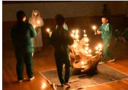
《キャンドルファイヤー》