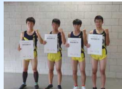
【通信陸上400MR第2位の陸上部】

※通信陸上で第2位になった男子400MRは1位との差がわずか0.11秒で、惜しくも全国ジュニアオリンピック大会への出場はなりませんでしたが、高砂中の底力を見せてくれました。