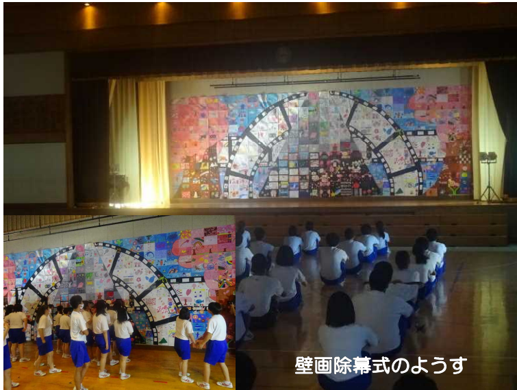
壁画除幕式の様子

今年、新型コロナウイルス感染症の影響で、例年どおりの高中祭を開催できませんでした。しかし、そのような状況の中でも、全校生徒が何かを成し遂げるべく巨大壁画の製作に頑張りました。この壁画は生徒一人一人がA4版の画用紙に、自分の思いを絵にし、指定された色を塗り上げて完成させました。教員をふくめ全校生徒400人以上で作り上げた作品一枚一枚をつなぎ合わせ、1枚の大きな壁画となりました。学年ごとに行われた除幕式では、吹奏楽部のファンファーレ演奏の中、お披露目した瞬間、生徒達は感動して壁画に見入っていました。今回の壁画は震災からの復興をテーマに今までの軌跡と復興桜をイメージし、そこに個