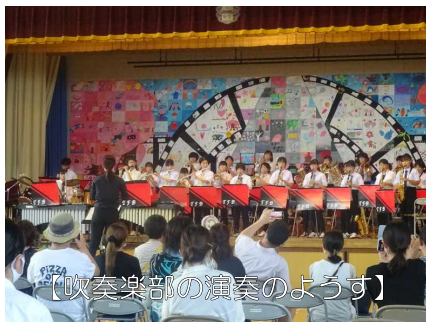
【吹奏楽部の演奏の様子】

8月29日(土)に吹奏楽部の3年生引退演奏会が開かれました。これまでの練習の成果を十分に発揮できた演奏会でした。本来であれば吹奏楽コンクールで披露するはずだったコンクール曲。部員が一丸となり、真剣に演奏し、迫力もあり繊細さもある素晴らしい音色で合奏していました。それ以外にも、なじみのある曲を披露し大いに盛り上がりました。1時間弱の演奏