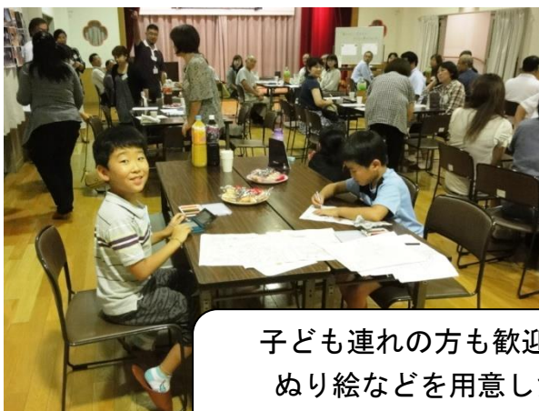
子ども連れの方も歓迎！ ぬり絵などを用意した 子ども用スペース