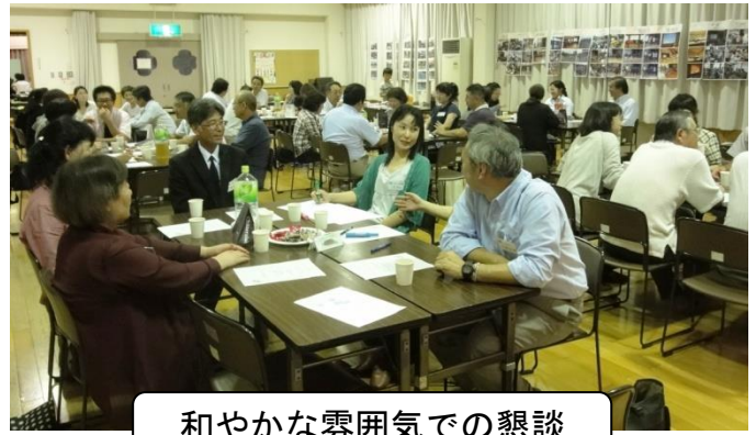
和やかな雰囲気での懇談