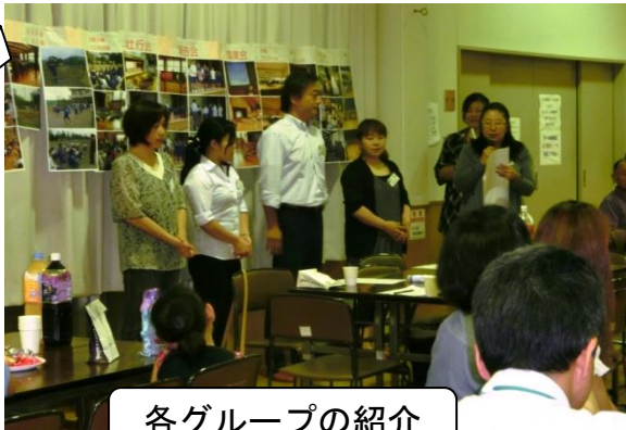
各グループの紹介