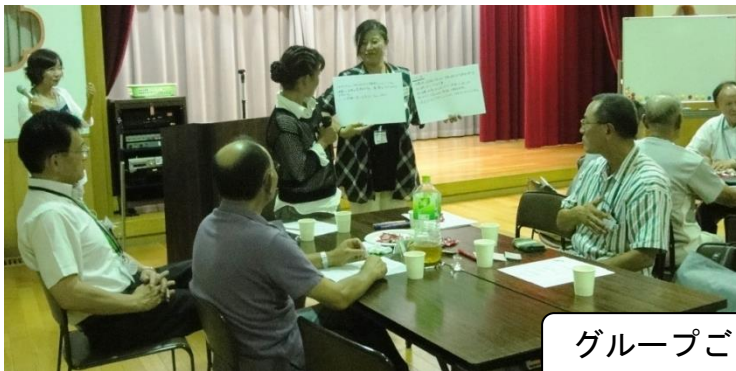
グループごとに発表