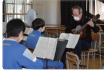
地域で活躍している方々からの学習活動支援 音楽（ギター）、国語（書写）、 保体（柔道）で実施