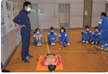
非常時や避難所開設時に地域の一員として活躍できる力を養う防災訓練（AEDの使い方、仮設トイレ設置訓練の様子）