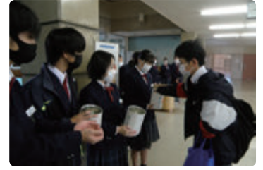
災害復興支援や赤い羽根などの募金活動（例年は近隣スーパー店頭で実施）