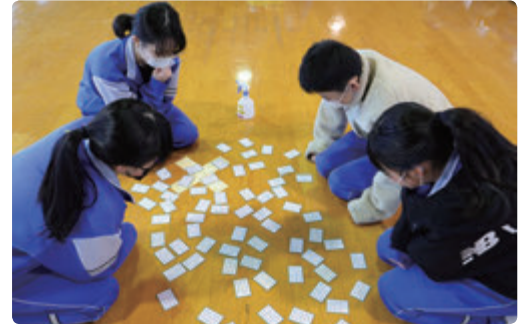
校内かるた大会 （例年はコンパス住吉台との連携・協力で実施）