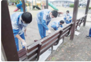
近隣公園ベンチや遊具の、塗装作業