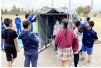
小中合同防災訓練