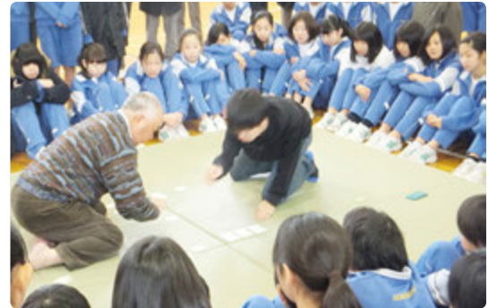
コンパス住吉台との連携・協力による「校内かるた大会」