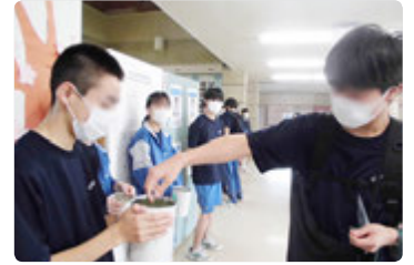
災害復興や支援のために、近隣スーパー店頭で行う募金活動