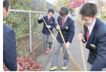
秋季に行う、地域内歩道の落ち葉掃き