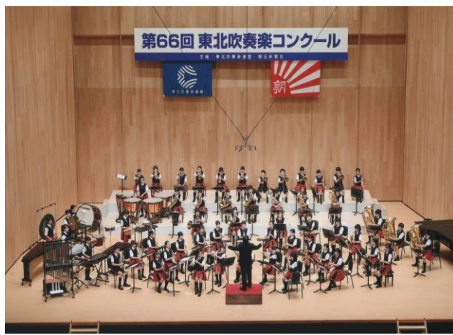
令和5年9月2日 石巻市・マルホンまきあーとテラスにて