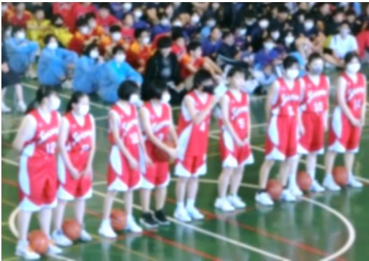
↑部活動紹介の様子

各学年代表生徒からの話では、それぞれが自分の目標を定め、勉強や部活動、行事、生活面などにおいて具体的にどのように取り組みたいかを述べており、決意を新たにしている様子が伝わりました。そして、発表の様子を真剣に見つめる生徒たちの姿からも、新たな年度への前向きな気持ちを感じ取ることができました。ぜひ生徒一人一人が自分なりの一步を踏み出せる、そんな一年にしてほしいと思います。