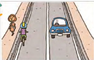
【知ってる?守ってる?自転車利用の交通ルールとマナー】(政府広報オンラインより)