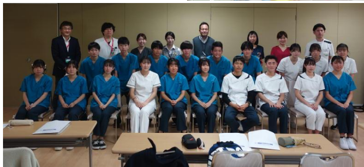
↑東北公済病院において記念撮影