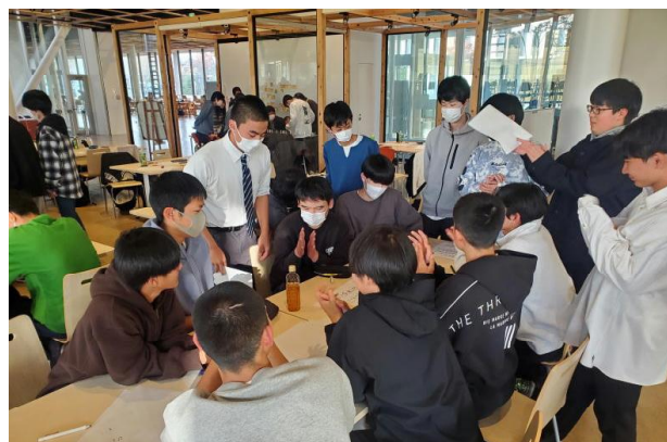
写真上IKEA仙台、写真下東北大アントレプログラム