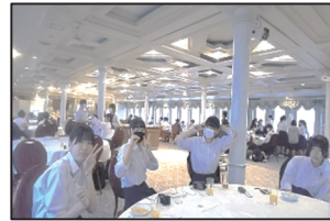
ナイトプログラム(ディナークルーズ)