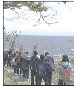
↑ 唐桑 御崎遊歩道

ここ3年間、コロナ禍のため野外活動は1泊2日で行っていましたが、今年は2泊3日に戻りました。3日間晴天に恵まれ、唐桑の絶景を堪能しながらのトレッキング、気仙沼東日本大震災遺構・伝承館や南三陸町での震災学習、まゆ細工体験、漁業体験、松島観光と盛りだくさんの活動を十分に味わうことができました。また、中学校入学後初の泊を伴う行事の準備を昨年度から行ってきた実行委員も、大いに成長できたことと思います。その力を学年全体の力とし、これからの行事にも十分に生かしてほしいと思います。