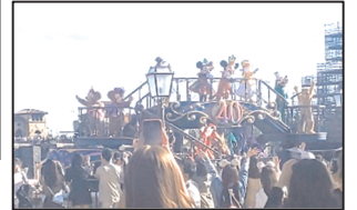
東京ディズニーリゾート