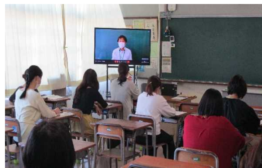
リモートでの学年保護者会

また学級懇談では、御家庭でのお子様の様子などを聞かせていただいたり、様々な御意見をいただいたりしました。学校内でも共有し、今後の教育活動に生かしていきたいと思っております。