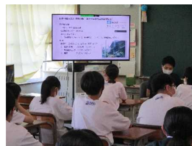
教室のモニターで視聴

地震で一番大切なことは「物の下敷きにならない」ということだったので少しびっくりしました。物の下敷きにならないければ、火災からも逃げられるので気をつけようと思いました。津波から助かるには自分で考えて行動しなくてはいけないけど、もし自分がその状況になったとき、行動できるだろうかと思いました。