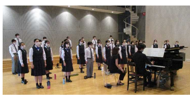
いざ本番へ！合唱県大会リハーサル