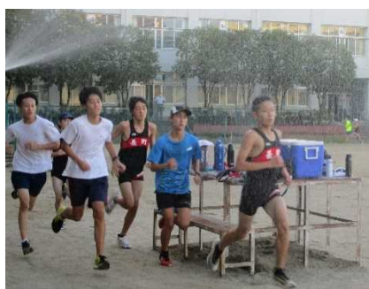
努力を積み重ねた駅伝練習