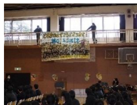
モザイクアートは現在MMホールに掲示してあります