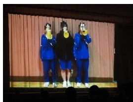
各部活動の後輩からのメッセージ

卒業生と在校生がお互いを思いやり、それぞれに準備をしてきたものが形として表された素晴らしい会でした。