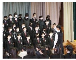
1、2年生の合唱「あとひとつ」