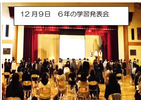
12月9日 6年の学習発表会