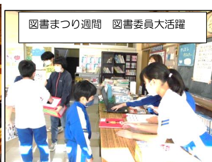
図書まつり週間 図書委員大活躍