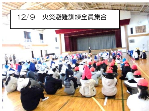
12/9 火災避難訓練全員集合

感染レベル1の今だから、できることを積極的に行っています。12月9日は、火災で防火扉が閉まる中を避難する訓練をしました。体育館に全員集合することも今年初めてでした。保護者の皆様には、「防災ずきん」をそろえていただきありがとうございました。