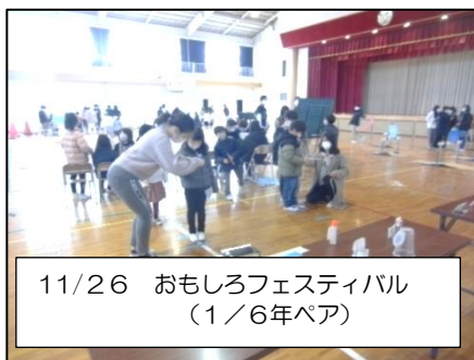
11/26 おもしろフェスティバル (1/6年ペア)

保護者の皆様には、御支援・御協力を大変ありがとうございました。今年の冬休みは18日間、（成人の日も含む）たっぷり休みが取れますので、どうぞ健康でお過ごしいただき、新年もまた御協力をよろしくお願いいたします。