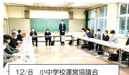
12/8 小中学校運営協議会

12月8日、向山小と愛宕中で一つのコミュニティ・スクールが誕生しました。15名の委員さんたちが就任いたしました。会長、会長などの役員が決まり、広報担当の方には、さっそくカラー版のお便りを作っていました。保護者の皆様、地域の皆様にも配付いたしましたので御覧ください。