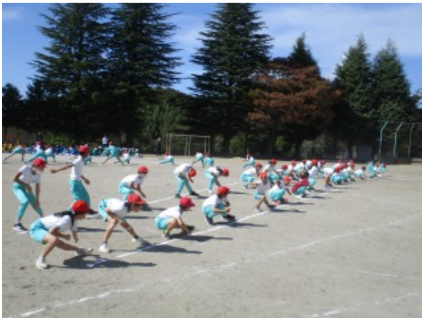
21日(土)に児童館で行われた児童館まつり「ハロウィーン☆サンフラワーランド」の様子です。約100人の子供たちが、仮装をするなどして楽しく