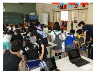
ログインに挑戦している様子