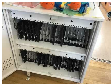
クロームブックの充電保管庫

今後、学校で徐々に授業に活用し、学校での使用に慣れてきたらご家庭に持ち帰る練習を行う予定です。その際には、改めてお便りでお知らせします。