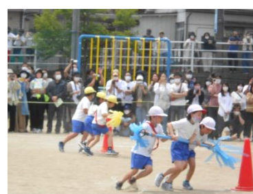
3年 回れ回れ国見タイフーン