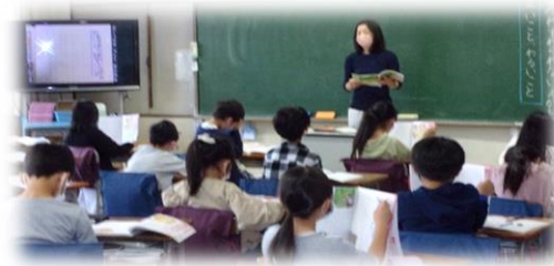
2年生 特別の教科道徳「わすれられないえがお」善悪の判断, 自律, 自由と責任について友達と考えている様子

お願い ○6月24日(金)に、引き渡し訓練を行います。感染防止のため、今年度も1・4年生のみの実施といたします。引き渡し訓練を実施できない学年も各ご家庭で確認をお願いいたします。