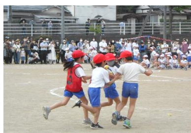
2年 ボール送りリレー