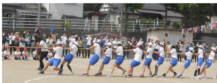
5年 令和綱引き合戦～国見の陣～