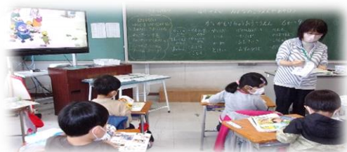
1年生 「みんなのこうえんであそぼう」公園で遊ぶときの約束について学習している様子

各学年・学級でも子供たちの規範意識を高めることをねらいとした授業が展開されています。その様子を少しずつ紹介していきます。