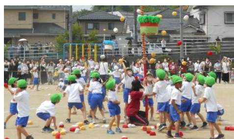
1年 ノリノリ! チェッコリ玉入れ