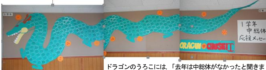
【先輩方への応援メッセージ】

ドラゴンのうろこには、「去年は中総体がなかったと聞きました。去年の3年生の分まで頑張ってください。応援しています。」や「日々真面目に練習に励んでいる先輩、尊敬しています。」などのメッセージの数々が・・・。