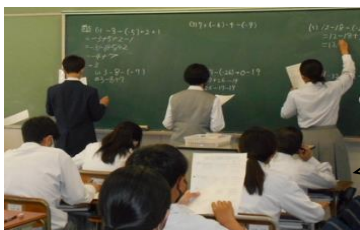
【一学年 授業風景より】

5月6日(木)より、気温等の上昇に伴い服装の軽装化を実施し、夏服への移行を始めました。しかし、まだまだ天候は不安定な状況のようです。寒く感じる時などは、学校指定のブレザーやベスト、下着で調節する体調等の自己管理をお願いします。