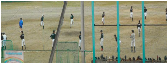
【放課後の 部活動の様子】

本市における新型コロナウイルス感染症に係る緊急事態宣言から「まん延防止等重点措置」が5月11日(火)まで適用されておりましたが、ようやく活動が緩和されました。運動部の生徒にとっては、ちょうど市中総体1か月前の時期であるということで、多くの部が試合を見据えた他校との練習試合等、計画し実施しています。放課後の練習もこれまでに引き続き、感染症対策を行いながら、練習に励んでいます。校舎内廊下には、1・2年生から先輩方への応援メッセージが掲示され、中総体に向けて『TEAM 郡中!』一丸となっています。今年度の中総体実施に際しては、様々な制約の中で行われることになるとは思いますが、これまで積み重ねてきたことを存分に発揮してほしいと思います。中総体まであと2週間となりました。ご家庭でもお子様の体調管理をお願いいたします。