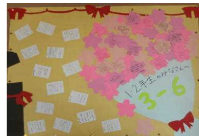
▲ 3年6組は卒業式がテーマです。