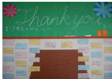
▲ 3年5組の作品は勉強がテーマです。