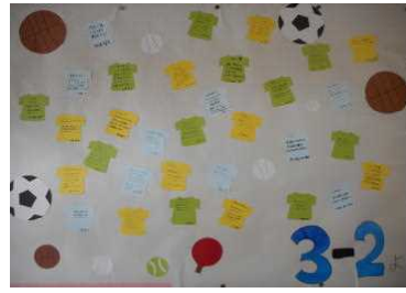
▲ 3年2組の作品は部活動がテーマです。