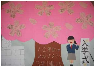
▲ 3年1組の作品は入学式がテーマです。

3年生の各クラスが、1・2年生へお礼や激励のメッセージを作成して掲示しています。中心となって作成した学年委員の皆さん、ありがとうございました。