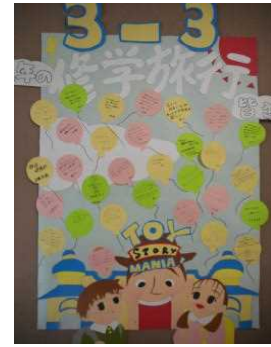
▲ 3年3組の作品は修学旅行がテーマです。