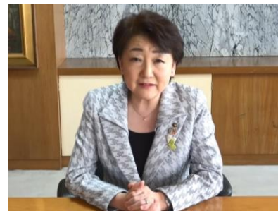
【ビデオで語りかける郡市長】

差別や偏見をなくすために自分たちが大事にしなければならないことは何かを考え、話し合いました。その後、各学級の意見を生徒会執行部の生徒が中心となってまとめました。郡山中学校全体で大切にしていこう合言葉、それを実現させるための行動目標を、今後生徒会から呼びかける予定です。この取組がゴールではなく、意識しながら、ともに相手の気持ちを考えながら生活していくことが大切です。その後の子供たちの様子を、次の機会にお知らせしたいと思います。