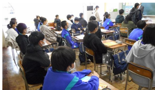
【考える時間を大切にします】

仙台市全体で取り組んでいるいじめ防止『きずな』キャンペーンの一環として、「分かり合おう 認め合おう いじめのない学校を目指して」をテーマに、すべての学級で「差別」や「偏見」について考える授業を実施しました。郡仙市長からのメッセージ動画を視聴し、“コロナウイルス感染の噂がSNSで投稿されているのを見た”という設定で、噂になっている人を守るために噂を発信したり、広めたりする人にどう声をかけるか、