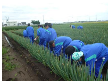
津波被災農家にて綿花畑の除草作業