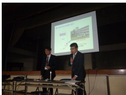
大学准教授と大学生の講演

本シンポジウムでは、生徒会が司会や進行を担い、大学准教授とその教え子の大学生が講演で共演し、取材報道班による取材結果と各訓練班の活動を紹介している。最後に教育委員会の防災訓練などの指導講評を行い、視聴参加者として本校生徒と地域住民などが共に防災教育を学んでいる。