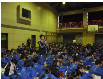
生徒の質疑や取材報道班の報告