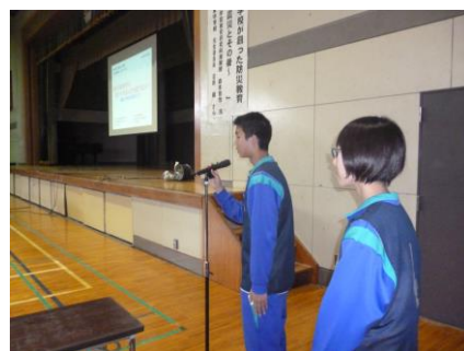
生徒会が司会進行