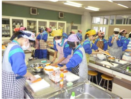
炊き出し調理と配給