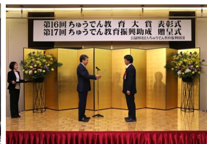
ちゅうでん教育大賞