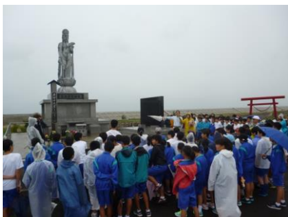
被災地を視察し慰霊塔で祈り

1年生・約200人が、仙台市沿岸部の津波被災地で農業を営む方々を支援するため、9月13日に被災地を視察し、その後に綿花畑の除草作業を行っている。大震災前は広大な水田地帯であったものの、津波の塩害が残る中、稲作に変わり手作業で綿花を栽培している。生徒たちは小雨が降るにも関わらず、懸命に除草作業に取り組んでいた。