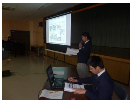
ユネスコスクール東北大会