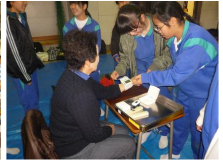
救急救護(血圧測定等)