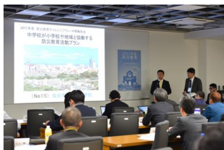
防災教育チャレンジプランでの実践発表

教員が、内閣府等が主催する「防災教育チャレンジプラン」にて、本実践を全国に発信している。また、本校の防災教育成果は、「ちゅうでん教育大賞」で優秀賞を受賞している。