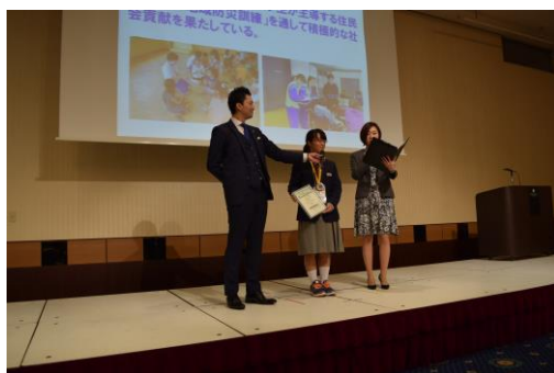
ボランティアスピリットアワード

生徒会がボランティアスピリットアワード2017にて、北海道・東北ブロックでコミュニティ賞を受賞し、本実践の成果を発表している。また、生徒会がユネスコスクール東北大会にて、実践成果を発表している。