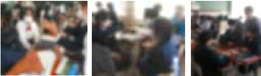
上段左「音楽」の授業。 ギターの弾き方の練習。 上段右「体育」の授業。 心肺蘇生法の練習。 下段「英語」英会話をC hromebookで録画しな がらの学習。