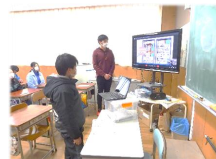
思いやりも持って 使いましょう