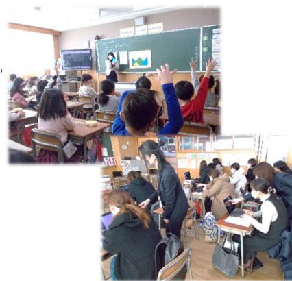
1年算数「かたちづくり」の授業と一人一台端末を使用した4年懇談会の様子

また、協働型学校評価重点目標について話し合う時間を設け、来年度は「読書」に絞って、学校・家庭・地域が三者一体となって取り組んでいくことを確認し、読書好きを増やすためにできることについて具体例を挙げながら検討しました。設定した内容については、今後更に精査し、新年度に入って改めて提示いたします。