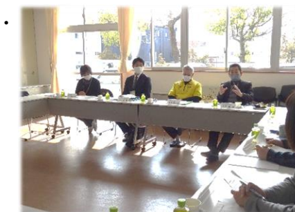
いただいた貴重なご意見を今後の教育活動に活かしてまいります