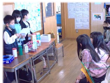
頼もしくなった2年生に拍手！