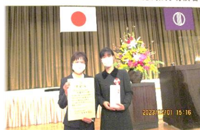
令和4年度 仙台市教育委員会教育功績者表彰式

地域社会に根ざした活動やボランティア活動の実践により、仙台市社会教育の振興に尽力した団体に贈られるもので、これまでの取組が評価され、今回の受賞となりました。大変名誉ある表彰を受けたKABAネットの方々の日頃の地道な努力に感謝申し上げます。