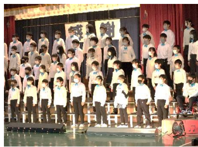
5年 合唱「スタートライン」