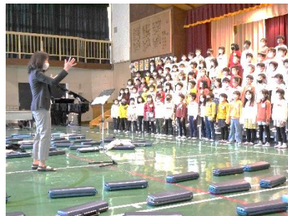
2年「LET'S GO いいことあるさ」