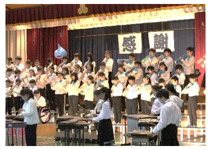
5年 合奏 「ドラゴンクエスト～ロトのテーマ～」