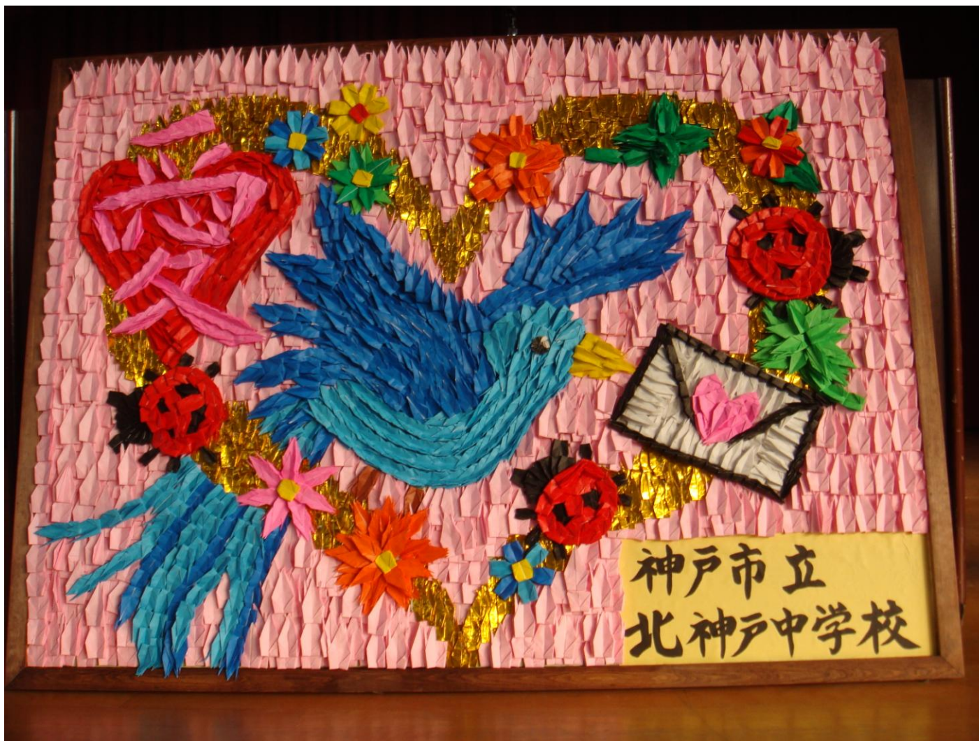
神戸市立北神戸中学校より寄贈された「復興支援」折り鶴