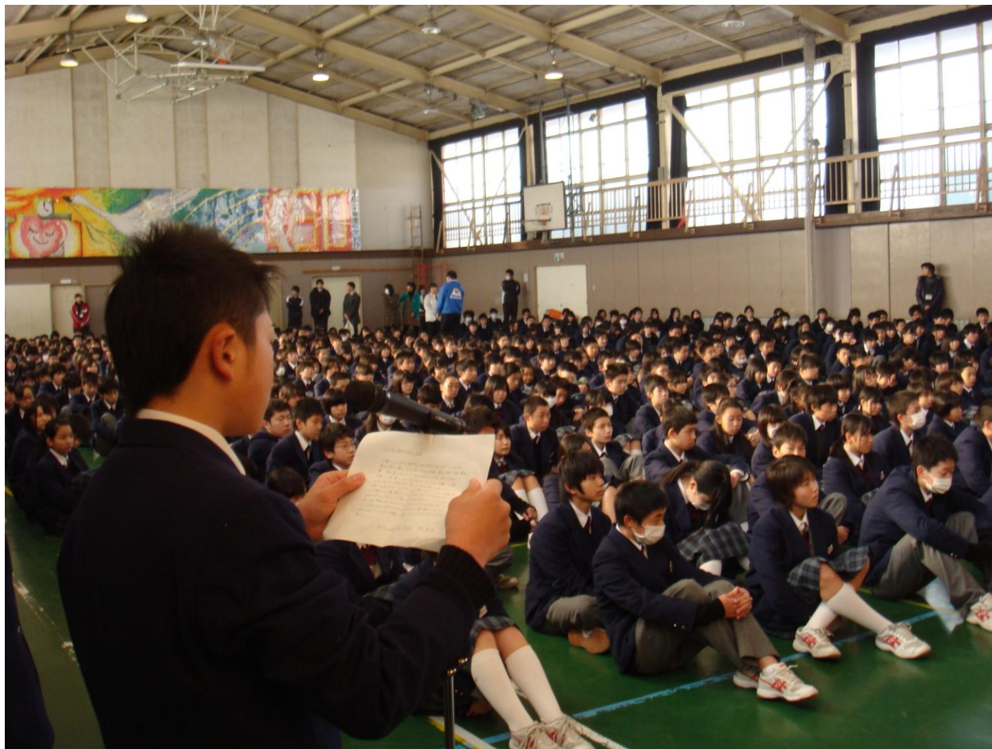
神戸市立北神戸中学校からの「復興支援」寄贈紹介式の様子