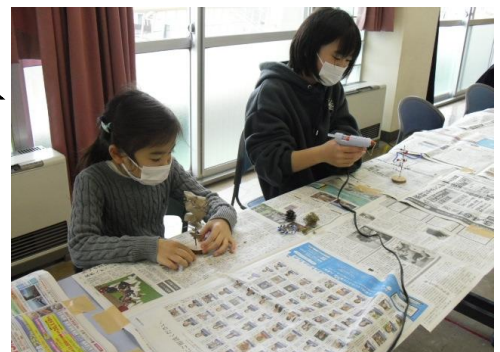
ハートフル土曜のひろば ～創作活動(木の実などを使って)～