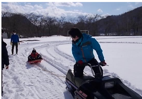
雪どあそべんちゃーin大倉 ～スノーモービルでそり遊び体験～