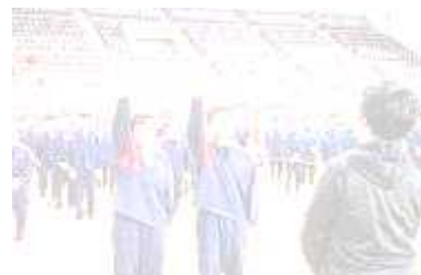
球技大会 選手宣誓