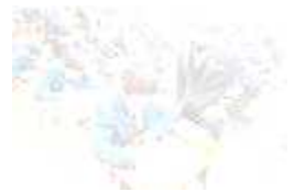
数学の授業の様子

生徒の学力向上を目指し，工夫した授業を進めています。数学科では，少人数指導やチームティーチング（TT）を積極的に取り入れ，個に応じた指導を展開しています。英語科では，ALTの先生との授業を週一回実施し，コミュニケーション能力向上を図っています。また，小学校と連携して毎日の自主学習（1ページ学習）の提出など，学習習慣づくりの継続的な取組を行っています。