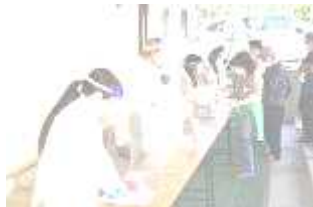
避難所開設訓練の様子

また，地元の三神峯公園や天沼の清掃活動に，たくさんの生徒が参加するなど，「地域とともに」の精神が根付いています。