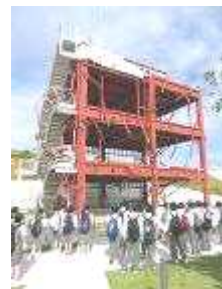
自然体験学習（2年生）

「より良い生き方を自ら学ぶために」を柱として，3年間を通した総合的な学習の時間で「生き方」について学びます。1学年では「防災」「福祉学習」，2学年で「職業講話」や「職場体験学習」を行い，3年生では「自己の夢を実現させるために」をテーマに，進路実現を目指します。修学旅行や自然体験学習においても，テーマを意識させ，「生き方」を3年間継続して学んでいきます。