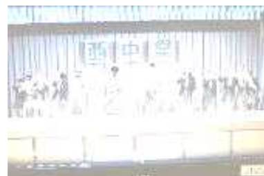
西中祭のステージ発表