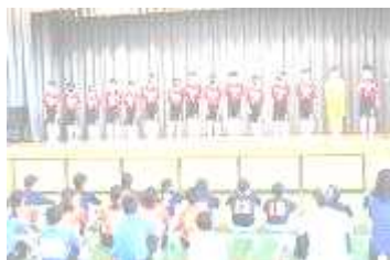
3年生の決意表明式

本校は部活動が盛んで，朝から校庭や体育館に生徒たちの元気な声が響きわたっています。また，地域の方々や保護者の皆様に支えていただきながら，休日も意欲的に活動が行われており，各大会で入賞を果たしています。文化面でも，各種コンクールや展覧会に積極的に参加し，多くの成果を上げています。特色ある活動として，総合文化部科学コースや有志の生徒がホタルの生育・放流を行っています。また，部活動の取組で培われた強い精神力や礼儀は，学校生活全般でも生かされています。校内で交わされる明るい挨拶や率先して取り組むボランティア活動は，地域の方々からも好評です。