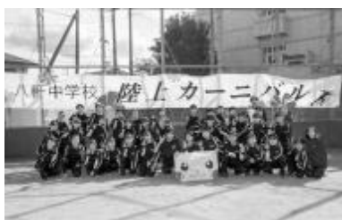
今回も天候に恵まれた「陸上カーニバル」(令和4年10月25日)