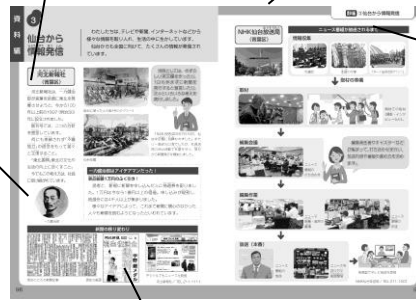
河北新聞の昔と今の紙面を比較できる。 昔の紙面：明治40年6月22日発行 今の紙面：平成30年2月17日発行

1863年、仙台市の町に生まれる。20歳を過ぎ、東華学校(仙台第一高等学校)、旧制第二高等学校(東北大学)、東京の学校にも進学。市会議員や県会議員を務めた後、新聞を東北地方の文化と産業の発展に役立てようと、河北新報社を設立。1897年、33歳で河北新報を創刊。当時は新聞をとる人が少なく苦しい経営だったが、様々な努力を重ねた。