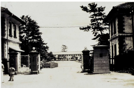
歩兵第四連隊兵営(大正時代ころ)

当館の建物は旧陸軍歩兵第四連隊の兵舎として明治7年ごろに建造され、昭和52年に現在の場所に移転・改修され昭和53年に仙台市指定有形文化財(建造物)となりました。昭和54年には仙台市歴史民俗資料館として開館、建物を保存しながらたくさんの歴史や民俗の資料を紹介してまいりました。このほど宮城県より有形文化財とする旨の通知をいただきました。今後は宮城県指定有形文化財(建造物)として当館を紹介してまいります。この機会にたくさんの皆様にご覧いただきたく、ご来館を心よりお待ちしております。