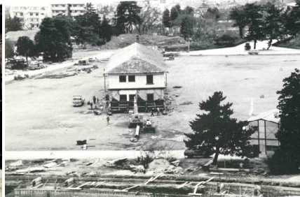
兵舎の移築(昭和52年)