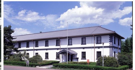
現在 (歴史民俗資料館)