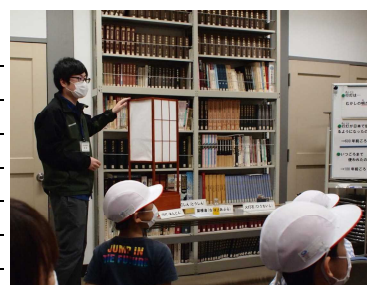
学校見学 あんどん 行灯体験