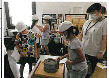
学校見学 石臼ひき体験