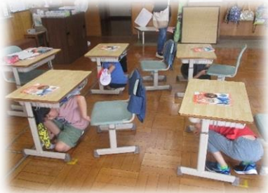
「学校：避難訓練（地震）一次避難」

7月1日（土）、地域合同防災訓練を実施しました。保護者の皆様には、フリー参観と引渡し訓練に参加いただきありがとうございました。学校では、①防災に関する授業、②地震想定避難訓練と地域の訓練の見学、③引き渡し訓練の内容で行いました。②の見学では、地域の方々が、力を合わせて簡易トイレを組み立てる様子を見学しました。いざという時にはこの簡易トイレで用を済ませることがある、ということを知りました。