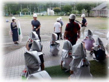
「学校：二次避難の様子」