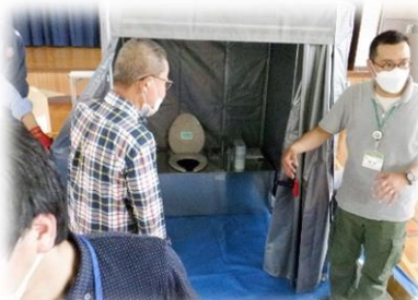
「地域：簡易組立トイレの組立訓練」