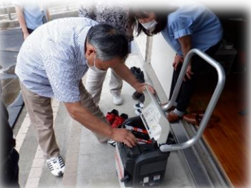
「地域：LPG 発電機の作動訓練」