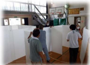
「地域：パーティションの組立訓練」