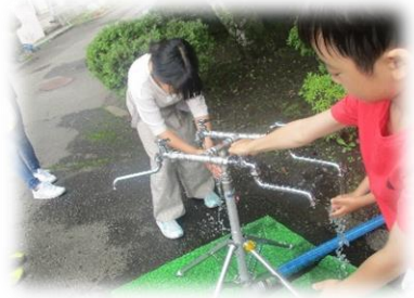
「学校：非常用水栓の見学・体験」