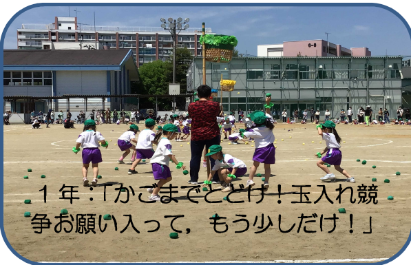
1年：「かごまでとどけ!玉入れ競争お願い入って、もう少しだけ!」

なお、PTAより賞品として、子供たち一人一人にノートを頂きました。ありがとうございます。