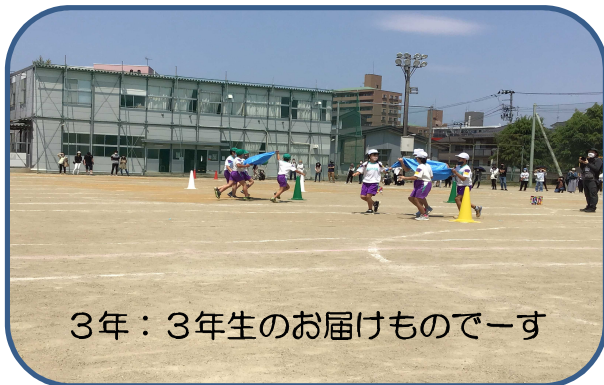
3年：3年生のお届けものでーす