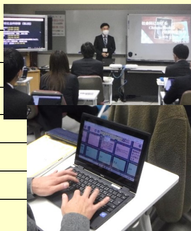
昨年度の研修の様子 (小学校社会科研修)

* ICT 機器活用研修では、ロイロノート、Google Workspace for Education を活用した授業づくりについての研修を行います。御検討の上、是非お申し込みください。