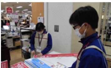
イオン仙台中山店

この活動にあたりましては、保護者の方にはたくさんのご理解をいただきました。また、お忙しい中、巡回の協力もいただきましたことに併せて心より感謝申し上げます。