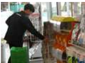
ファミリーマート国見ヶ丘店