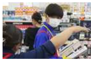
ケーズデンキ仙台西店