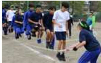
「大縄」25回も跳びました