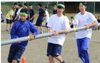
「バンブーサーフィン」

当日保護者の皆様には、子どもたちに熱い声援を送っていただきましたことに感謝申し上げます。ありがとうございました。