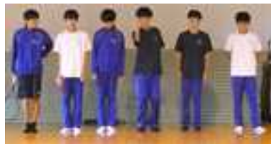
【男子テニス部】 「粘り強く決して諦めない強い心で勝つ！！」