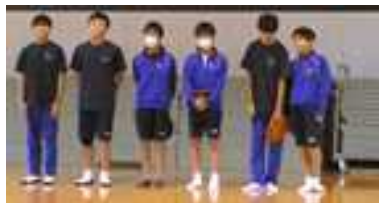
【野球部】 「Trial and Error」

本番で力を出すことの大切さと難しさ、自分の心と闘う強さ、応援のありがたさ等、いろいろなことを学び、更に成長する大会であることを願っています。