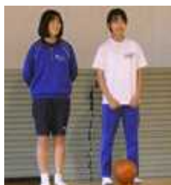
【女子バスケット部】 「燃え燃え球」