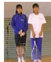
【女子テニス部】 「粘る・諦めない・笑顔で」