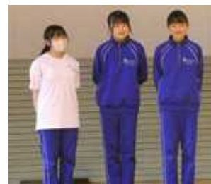
【体操部】 「美を意識する」