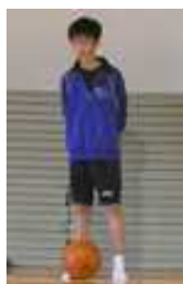
【男子バスケット部】 「オフェンス・ディフェンスを共に気を抜かず頑張る」