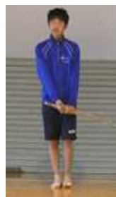
【剣道部】 「正々堂々自分自身に勝つ」